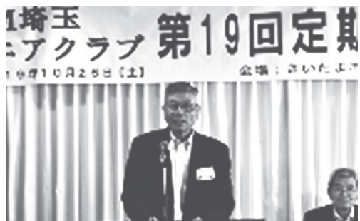
【埼玉】シニアクラブ 第19回定期総会

合写真を撮り、バスに乗りして須賀川市の牡丹園で見頃の紅葉や寒牡丹を鑑賞。その後、豪雨の傷跡も生々しい乙字ヶ滝を訪れ、まだ流量の多いこじんまりしたナイヤガラ滝を思わせる景色を楽しんだ。さらに次の袋田の滝では名物のこんにゃくとけんちんうどんの昼食後、いくらか早い紅葉の豪快な滝を鑑賞し一路バスに揺られるが無事帰宅した。